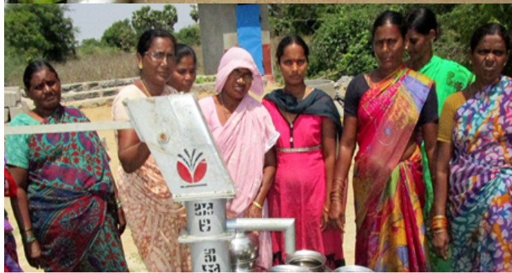
Un souper bénéfice qui profite à tous Laurence Lei Pages 5